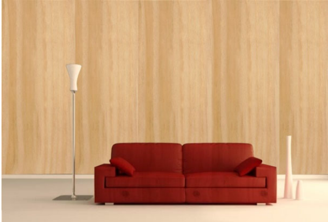
FIGURA 1. Fotomontaje Eucalyptus nitens (Dean. et Maiden).

calidad percibida (Sakuragawa, S., Miyazaki, Kaneco y Makita, 2005).