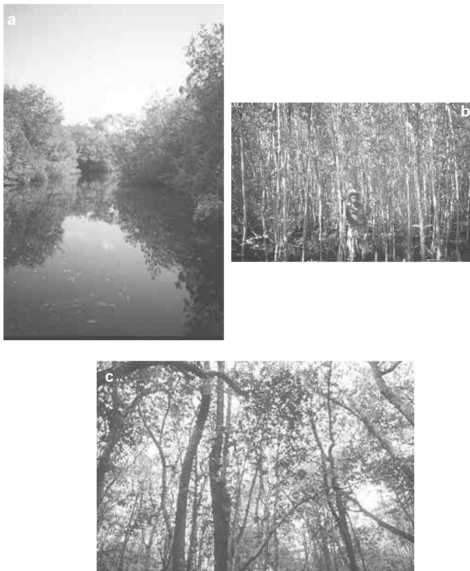
Figura 2. Zonas de protección (a), producción (b) y conservación (c) en los manglares del Ejido de San Blas, estado de Nayarit, costa Pacífica de México.