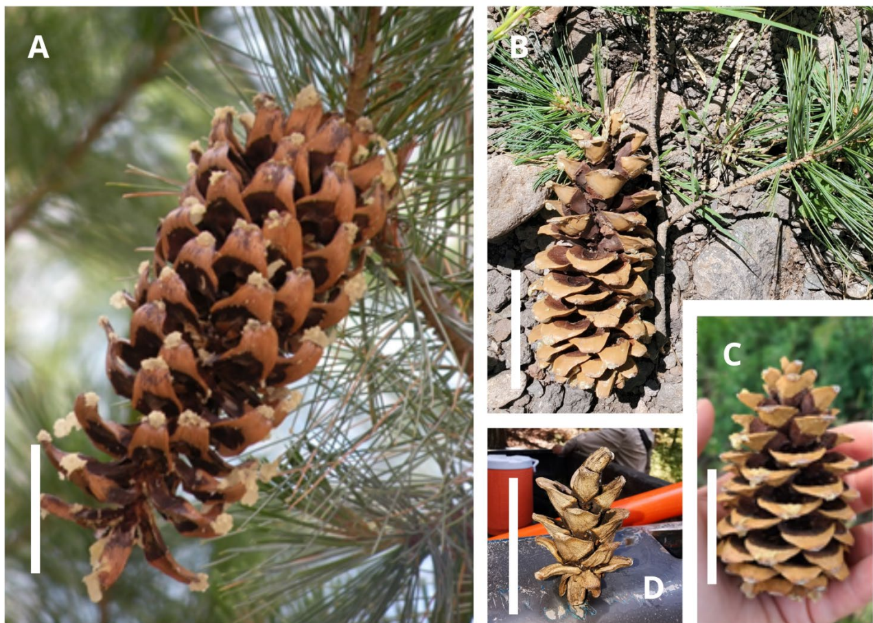
FIGURA 1. Conos de A) Pinus strobiformis , Tepehuanaes, Dgo., México. B) P. ×reflexa , New Mexico, E.U. C) P. flexilis , Wyoming, E.U., D) Cono atípico (6.5 cm de largo) de P. strobiformis , Madera, Chih., México.

Farjon y Styles (1997) consideraron que P. flexilis y P. strobiformis forman un complejo polimórfico en el que se aprecia una variación latitudinal clinal. El nombre de P. reflexa y sus sinónimos se aplica a las formas transicionales entre ambas especies. Varios autores (Shaw, 1914; Frankis, 2009; Bisbee, 2014, entre otros), han hipotetizado que estos caracteres intermedios pueden ser resultado de introgresión entre P. flexilis y P. strobiformis , lo cual fue posteriormente corroborado en un estudio molecular llevado a cabo por Menon et al. (2018), en el que se revela introgresión antigua entre ambas especies. Por tratarse de un híbrido establecido ( Pinus flexilis × P. strobiformis ), la manera correcta de expresar el nombre es Pinus × reflexa (Tabla 1).