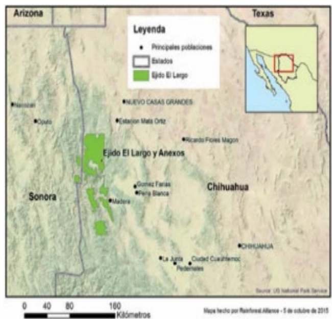
FIGURA 2. Ubicación del Ejido el Largo y Anexos, Mpio. Madera, Chih. (Luján et al. 2011; Hodgdon y Estrada, 2015).