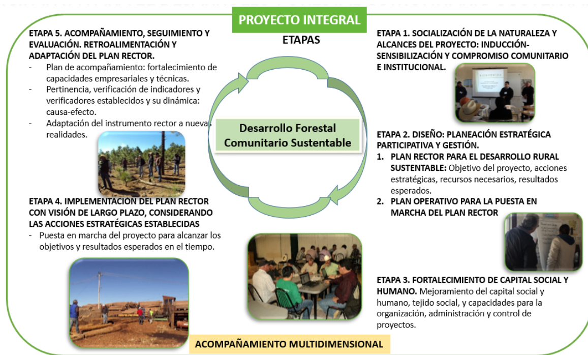
FIGURA 1. Componentes/Etapas estructurales del proceso de gestión estratégica participativa para el desarrollo forestal sustentable (Luján et al., 2019).

Etapas 3. Fortalecimiento del capital social y humano: necesidad de mejorar las capacidades del capital social, humano, tejido social y capacitación para la organización, que le permita la implementación, dirección, control y seguimiento del proyecto.